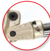
Egyszerűen kapcsolható 90°-ról 180°-ra a karok keresztezése nélkül