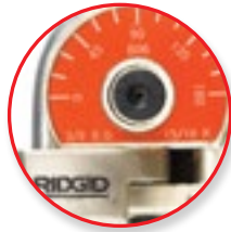
Könnyen olvasható szögmérő a pontos hajlításhoz