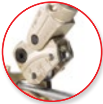
Görgős ellendarab a deformáció mentes és könnyű hajlításhoz