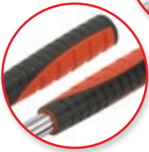
Kényelmes, ergonomikus fogantyú!

60%-kal kevesebb erőlkifejtést igényel a hagyományos csőhajlítókhoz képest