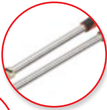
Extra hosszú kar, jobb hajlíthatóság, kisebb erőlkifejtés!